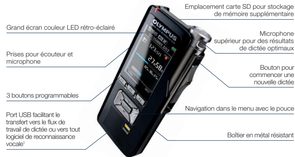
Schéma du système